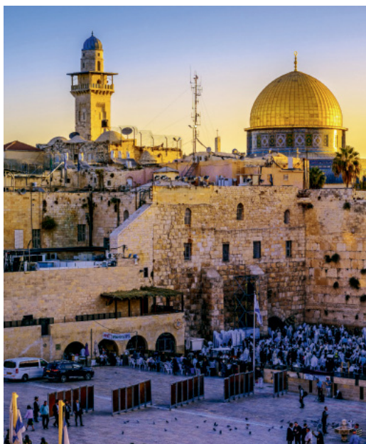
Jeruzsálem szent városa

hogy az utazás tágítja a látókörünket, de attól, hogy elmegyünk valahová és készítünk néhány fotót, nem fogunk megváltozni. Kialakult egy újfajta utazástípus – a transzformációs utazás –, amely ennél többet ígér. Elmélyülést, önreflexiót, személyiségfejlesztést, közeledést a természethez, a kultúrához és a spiritualitáshoz. Olyan belső és külső utazás egyszerre, amely azután sem ér véget, hogy hazaértünk. Sokszor egy jelentős életesemény készíttet transzformációs utazásra – mondjuk egy kapcsolat vége, vagy munkahelyváltás. Személyes krízisek idején gyakran megállunk, körbenézünk, keressük a