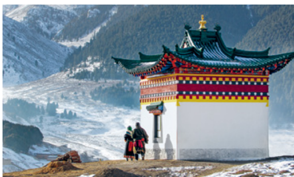
Egy távoli templom, Nepál, Phú

Nem könnyű meghatározni, milyen egy spirituális hely. Nagyon különböző helyeken élhetjük át a csodát: egy maja piramisonál, egy buddhista szentélyben, egy erdőben, egy hegyről aláereszkedve, vagy egy szent forrásba mártva a kezünket. Az egyik legbiztosabb jel, amiről felismerhetünk egy szent helyet, az érzelmi reakció, amit különleges atmoszférája vált ki belőlünk. A szent helyek felkeresésének legalább annyiféle oka lehet, mint amilyen sokfélék maguk a helyek. Például szeretnénk elmenekülni a mindennapok zajától, kalandra vágyunk, netán a történelem, a mítosz vagy a legendák vonzanak oda. Saját hiedelmeink és hitünk is arra sarkallhat, hogy felkeressünk egy számunkra