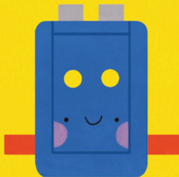
FÚRÓSABLON (FURATOKHOZ ÉS FATIPLIKHEZ)