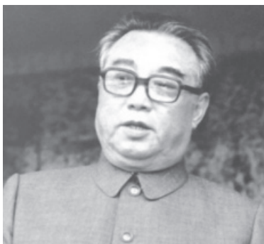
KIM IR SZEN

Észak-Korea Nagy Vezetője, a Koreai Népi Demokratikus Köztársaság megalapítója